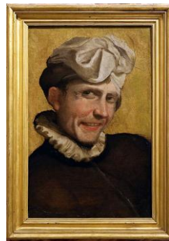
Annibale Carracci, Buffone che ride , 1583-4 circa, Galleria Borghese

Ci sono molti esempi comparativi, (tra cui: Buffone che ride del 1583-4 circa nella Galleria Borghese, Roma; e Giovane uomo nella Collezione Gazzoni, Bologna) che hanno la stessa pelle tirata al lato della bocca come il ragazzo dell'opera in oggetto, così come gli stessi occhi gonfi che sembrano essere stati posizionati in un punto troppo alto del cranio. 15