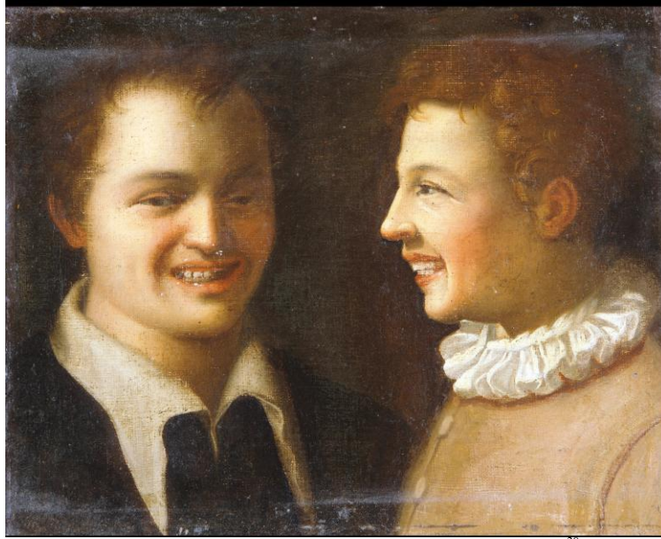
Cerchia di Annibale Carracci, Due figure che ridono , Seicento 29