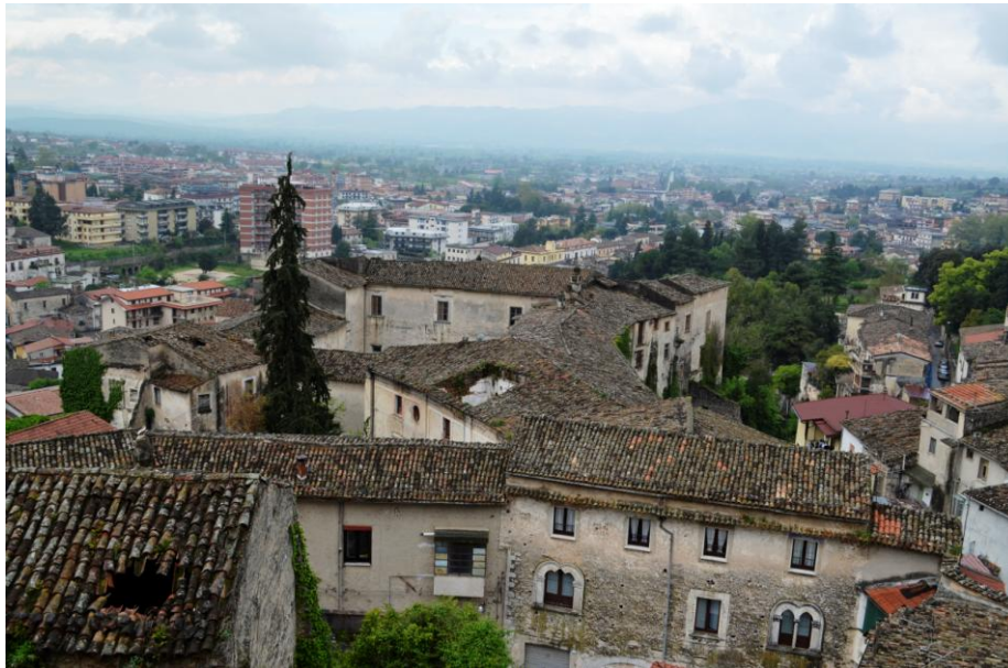
Palazzo ducale di Piedimonte Matese - Vista dall'alto

All'interno della parola "Cultura" ne è contenuta un'altra che rappresenta una delle sue più importanti funzioni, la parola "Cura". Bisogna davvero prendersi cura dell'Italia, e per farlo è necessario porre al centro dell'azione di governo l'istruzione e la cultura, non solo quale sintesi di antichi valori e significati tradizionali, ma come investimento per il futuro dell'Italia, vero volano economico e creatore di ricchezza e lavoro... che sia dato un forte sostegno all'impresa creativa e culturale fatta di musei, teatri, filiere audiovisive e musicali, che attira turisti da tutto il mondo e che oltre a generare valore economico, offre un importantissimo contributo nel rammendare il tessuto sociale delle nostre città; ...che le aree interne del nostro Paese siano in grado di ricostruire il loro tessuto sociale ed economico a partire dalla cultura come risorsa fondamentale di qualità della vita, di sviluppo imprenditoriale, di costruzione di un progetto di futuro in cui riconoscersi...". 47