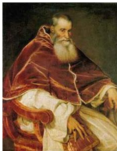
Tiziano, Ritratto di Paolo III