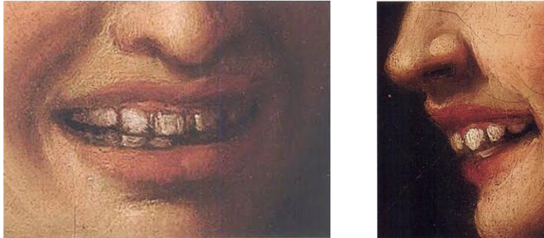
Particolare del viso delle due figure

Inoltre, i sorrisi sono sistematicamente un po' troppo ampi, avendo come risultato non tanto un'espressione di sincera felicità ma più che altro una di ilarità innaturale.