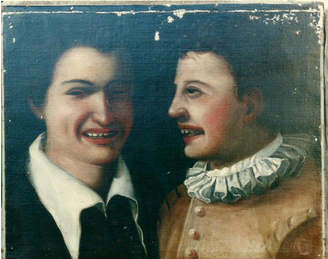
Anonimo, Pagliacci , Sec. XVII, olio su tela, cm 37 x 48, prima del restauro