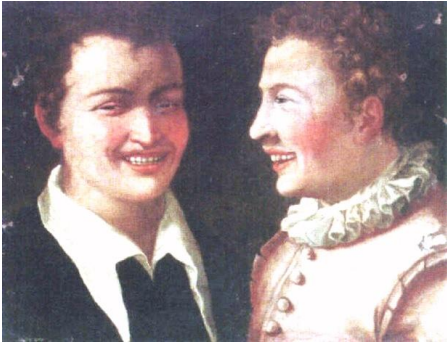
Cerchia di Annibale Carracci, Two laughing boys