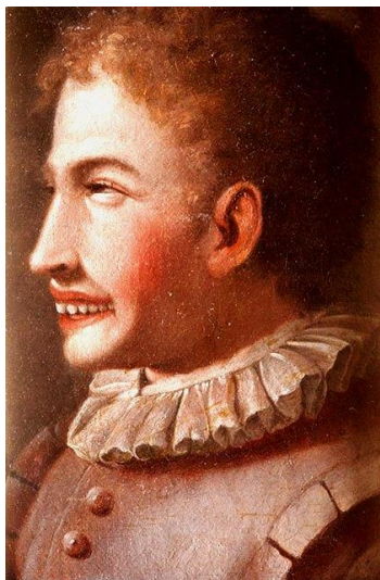
Annibale Carracci, Allegoria del Riso , 1581-1582, olio su tela, cm. 34,5 x 23, collezione privata 7

Nel 1674 l'artista Carlo Maratta, membro dell'Accademia di San Luca, fece apporre a fianco della tomba, in segno di omaggio, due busti dedicati a questi artisti. 6