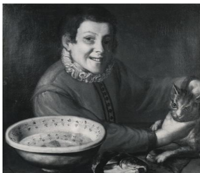
Anonimo - Campi Vincenzo - (?) - sec. XVI - Ragazzo che afferra un gatto , cm 37 x 27 O. Klein, New York, U.S.A.

L'atteggiamento realistico e beffardo mostrato dai protagonisti della tela, è assai prossimo, per tipologia ed espressione, al “ Ragazzo che afferra un gatto ”, sempre segnalato da Zeri nella collezione O. Klein di New York.