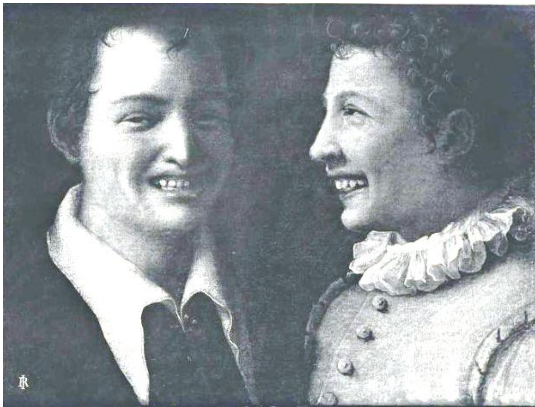
Annibale Carracci (copia da?), Due giovani che ridono , 1584/85 ca?, olio su tela, cm. 36 x 44, inv. Qq 1930, n. 588, Collezione Farnese