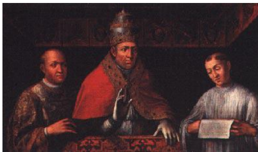
Papa Bonifacio VIII Caetani, Roma, Palazzo Caetani Tratto dal sito internet della Fondazione

Sono infatti i corridoi della curia che possono spalancare nuove porte ai Farnese e alla loro ambiziosa sete di gloria e potere. Nel 1519 Alessandro diviene cardinale, e prosegue la sua opera di consolidamento e accrescimento della posizione dei Farnese. Le complesse manovre diplomatiche di Alessandro e la celebre bellezza della sorella Giulia, amante del cardinale Borgia, papa Alessandro VI, conducono la famiglia Farnese alla sua stagione d'oro.