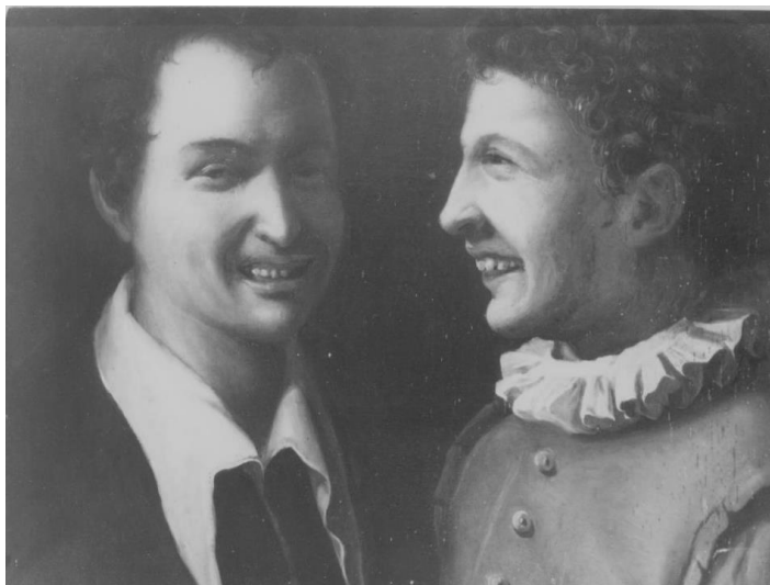
Anonimo, Giovani che ridono , sec. XVII, tela/ pittura a olio, cm 35 x 44

La tela “ Giovani che ridono ” della Collezione “Camillo D'Errico” si trova nel Palazzo Lanfranchi, Piazzetta Pascoli, del Comune di Matera.