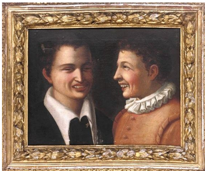
Seguace di Annibale Carracci, Two laughing boys Study

http://www.artnet.com/artists/annibale-carracci/two-boys-laughing-HBGpFLfjSZdXyU5Rp5Z8eA2