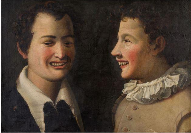
Pittore del XVII secolo, Giovani che ridono , olio su tela, cm. 40 x 60

Il dipinto trova precisa similitudine con la tela custodita nel Museo di Capodimonte oggi codificata nel catalogo come copia di Annibale Carracci. 24