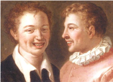
Cerchia di Annibale Carracci, Two young men laughing

http://www.artnet.com/artists/annibale-carracci/two-laughing-boys-eu2gT5iWKgTBM_cQs4KF7g2