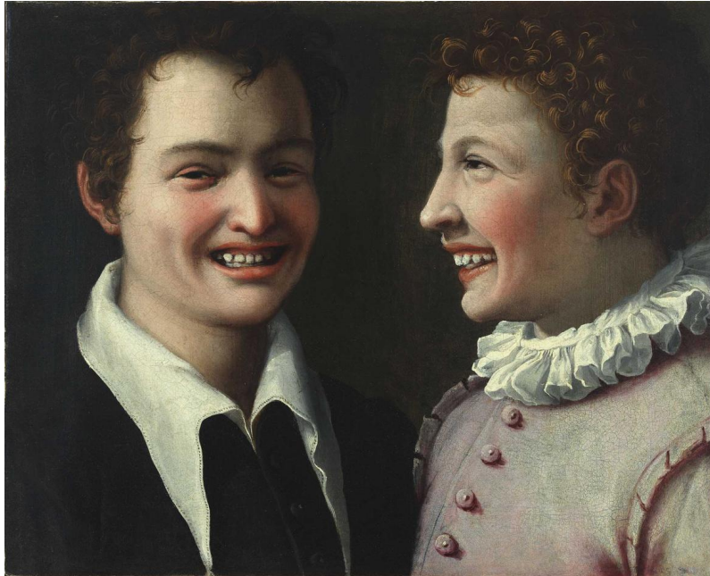
Annibale Carracci (copia da?), Due giovani che ridono , 1584/85 ca?, olio su tela, cm. 36 x 44, inv. Qq 1930, n. 588, Collezione Farnese

La ricerca mi ha fatto scoprire varie repliche, in Italia e all'estero, del famoso dipinto attribuito ad Annibale Carracci, ora a Capodimonte.