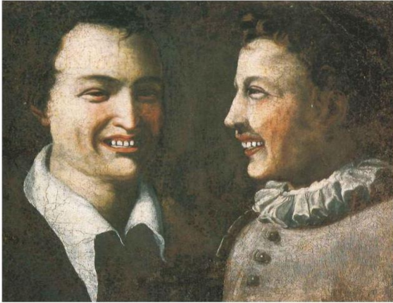
Pittore meridionale, Due giovani che ridono , Olio su tela, cm. 35 x 46, XVIII secolo

Il dipinto, il cui soggetto si pone a metà strada tra quadro di genere e ritratto, è la terza replica conosciuta di un originale perduto di scuola emiliana.