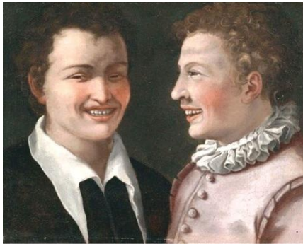
Seguace di Annibale Carracci, Two boys laughing