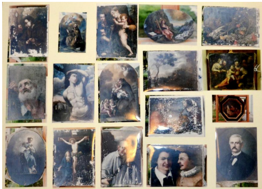
Foto tele Pinacoteca Comunale prima del restauro

Tra gli altri pezzi si ritirarono 17 tele, in pessime condizioni, attribuibili ad artisti della scuola napoletana del periodo tra il 1600 ed il 1800.