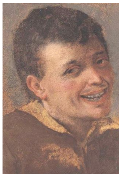
Annibale Carracci, Testa di un ragazzo che ride , olio su carta posato su tela, 28.3 x 19.4 cm. 16

Si riporta la scheda 17 del dipinto Due giovani che ridono presente nel Museo Nazionale di Capodimonte e facente parte della Collezione Farnese redatta da Pierluigi Leone de Castris e Mariella Utili.