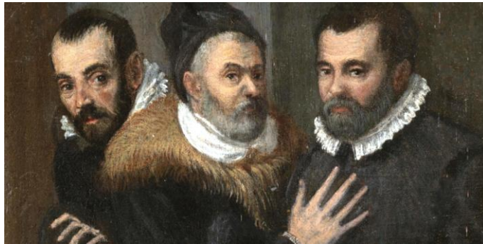
Scuola bolognese, Annibale, Ludovico e Agostino Carracci, XVII secolo, collezione privata

Il dipinto dei due giovani che ridono , uno rappresentato quasi frontalmente e l'altro di profilo, è un primo esempio delle opere giovanili del celebre artista bolognese Annibale Carracci e risale agli inizi degli anni '80 del 500; intorno al periodo in cui fu fondata l' Accademia degli Incamminati , dove Annibale, Ludovico e Agostino Carracci insegnarono l'arte del disegno dal vero.