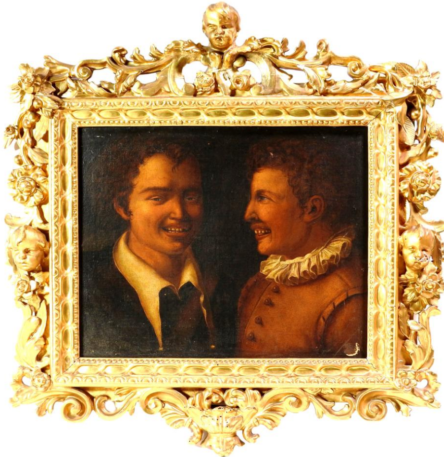
Seguace di Annibale Carracci, Ragazzi che ridono , XVII secolo 30

Olio su tela, in cornice antica in legno intagliato e dorato, lievi cadute di colore, alcuni difetti alla cornice, cm 39,5x50.