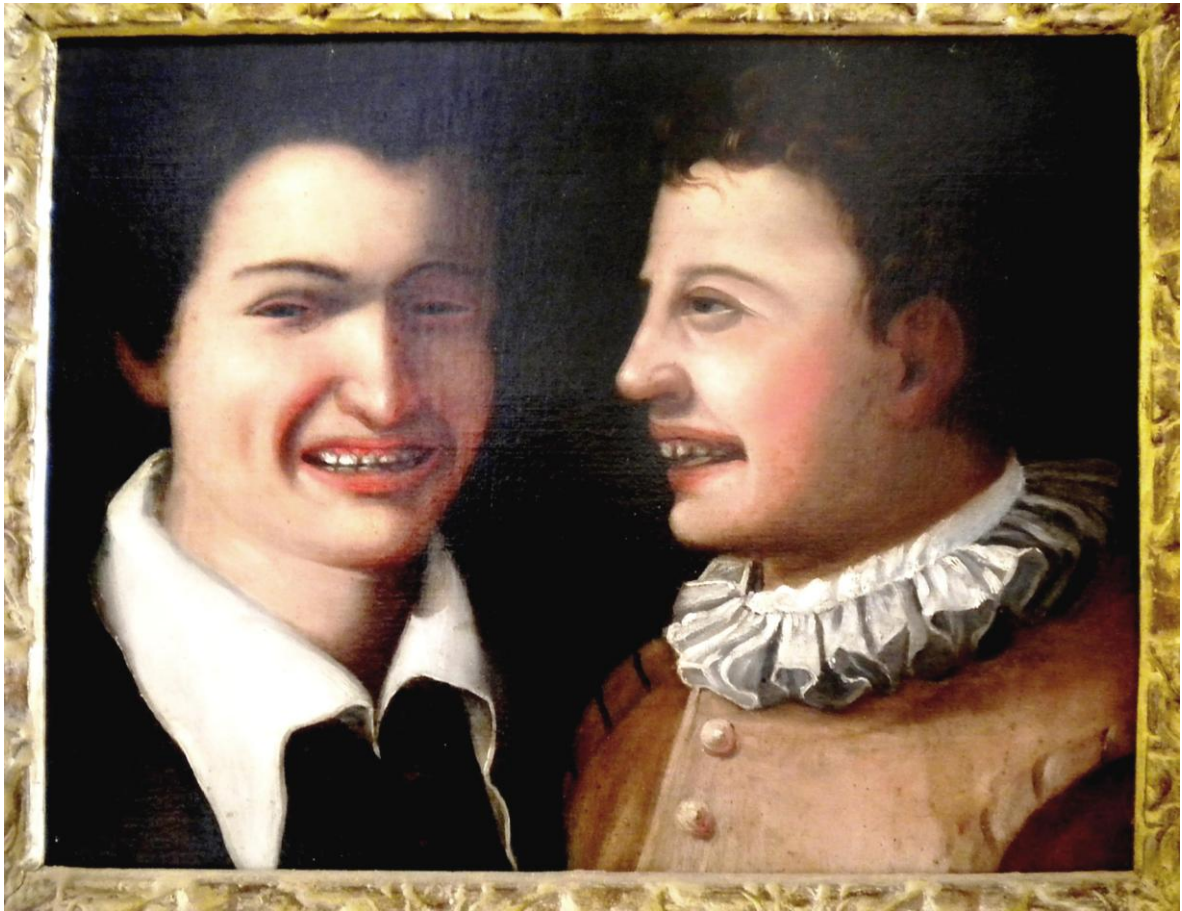
Anonimo, Giovani che ridono , Sec. XVII, olio su tela, cm 37 x 48, dopo il restauro